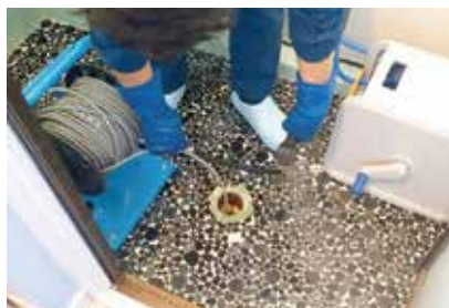
お風呂の排水管の詰まり