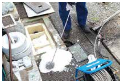
飲食店の排水管の詰まり