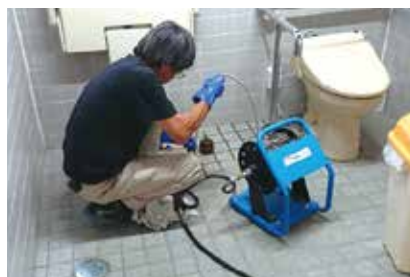
悪臭の原因をつきとめて高圧洗浄

排水口に水を流した後、 流れが悪い・水が溜まる・水があふれる・悪臭がする・コボンコボンという音 がしたら、排水管が詰まりかけています。原因は、油、髪の毛、石鹸カス、異物落下がほとんどです。排水管の詰まりはご自身では対応できません。そのまま放置しておくと被害が大きくなりますので、早急にトラブル箇所を特定して対応が必要です。創美社では、スコープを使って、排水管内部を視覚化しトラブル箇所を見つけます。ご相談いただければ、まずは現地調査(無料)をしてアドバイス・お見積もりいたします。