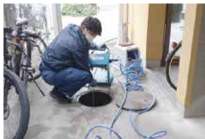
アパート共用部の排水管詰まり